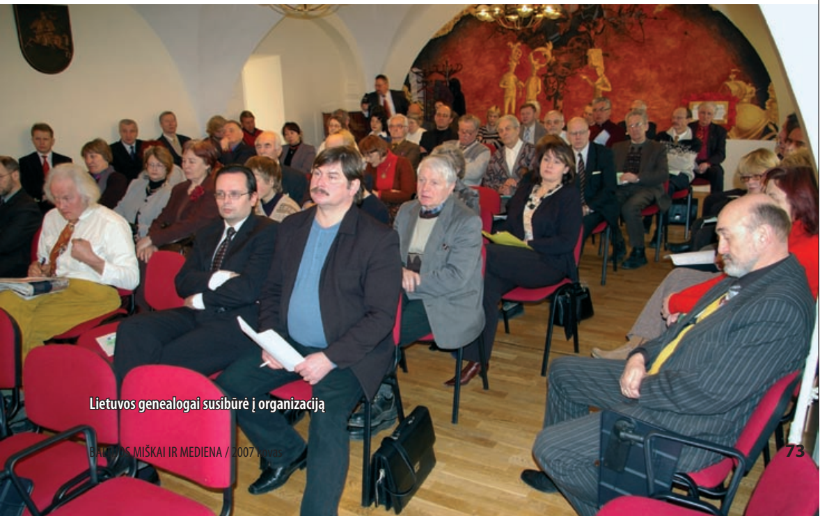
Lietuvos genealogai susibūrė į organizaciją