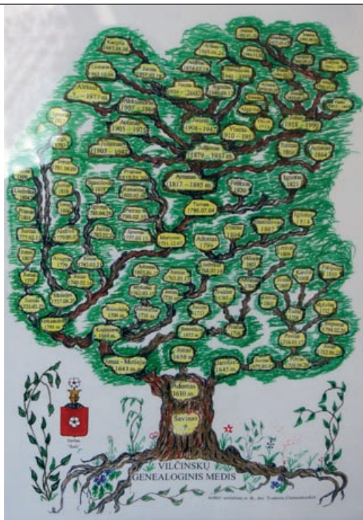
Suvažiavimo metu veikė genealogijos medžių ir knygų paroda

Vilniuje, Lietuvos technikos bibliotekos patalpose (buvusiuose Jėzuitų noviciato renesansiniuose XVII a. rūmuose), vasario 24 d. įvyko Lietuvos genealogų suvažiavimas, kurio metu patvirtinta Genealogų draugijos programa, įstatai, išrinkta organizacijos valdyba ir jos pirmininkas. „Genealogija – istorijos mokslo šaka. Žodis genealogija kilęs iš dviejų senosios graikų kalbos žodžių: genea – „šeima, giminė“, logos – „studijos, mokslas“. Tai mokslas apie šeimos, giminės kilmę, istoriją ir jos narių tarpusavio ryšius“, – rašoma britų enciklopediniame leidinyje „Encyclopedia Britannica“.